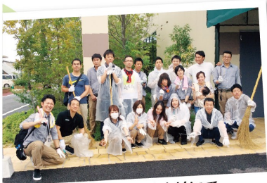
出発地点の浜線店にて。街をキレイに！がんばります！！