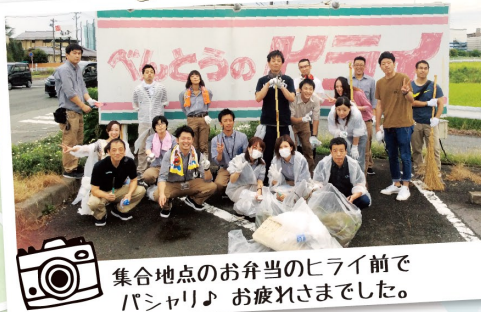
集合地点のお弁当のヒライ前でパシャリ♪ お疲れさまでした。