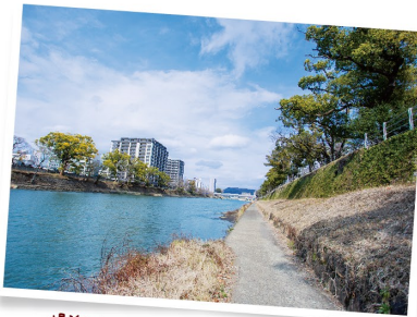
場所によって1は 川面すれすれを歩ける場所も