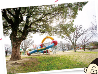
大きな木と遊具は、 地域の人の憩いの場