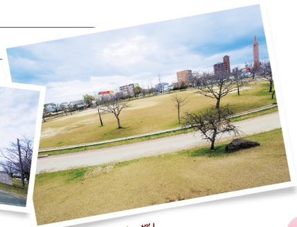
芝生広場に立つ木は全て桜! 花見の時期に桜に包まれます